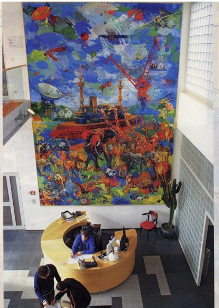
Das Werk in der Eingangshalle des Forschungszentrum CRP Henri Tudor auf Kirchberg stellt eine Art Luxemburger Arche Noah dar.

Ausstellung in der Galerie d'Art Maggy Stein der Gemeinde Bettemburg im Schloß, vom 3. bis 18. Dezember, von 14.30 bis 19 Uhr, Vernissage am 2. Dezember ab 18 Uhr.