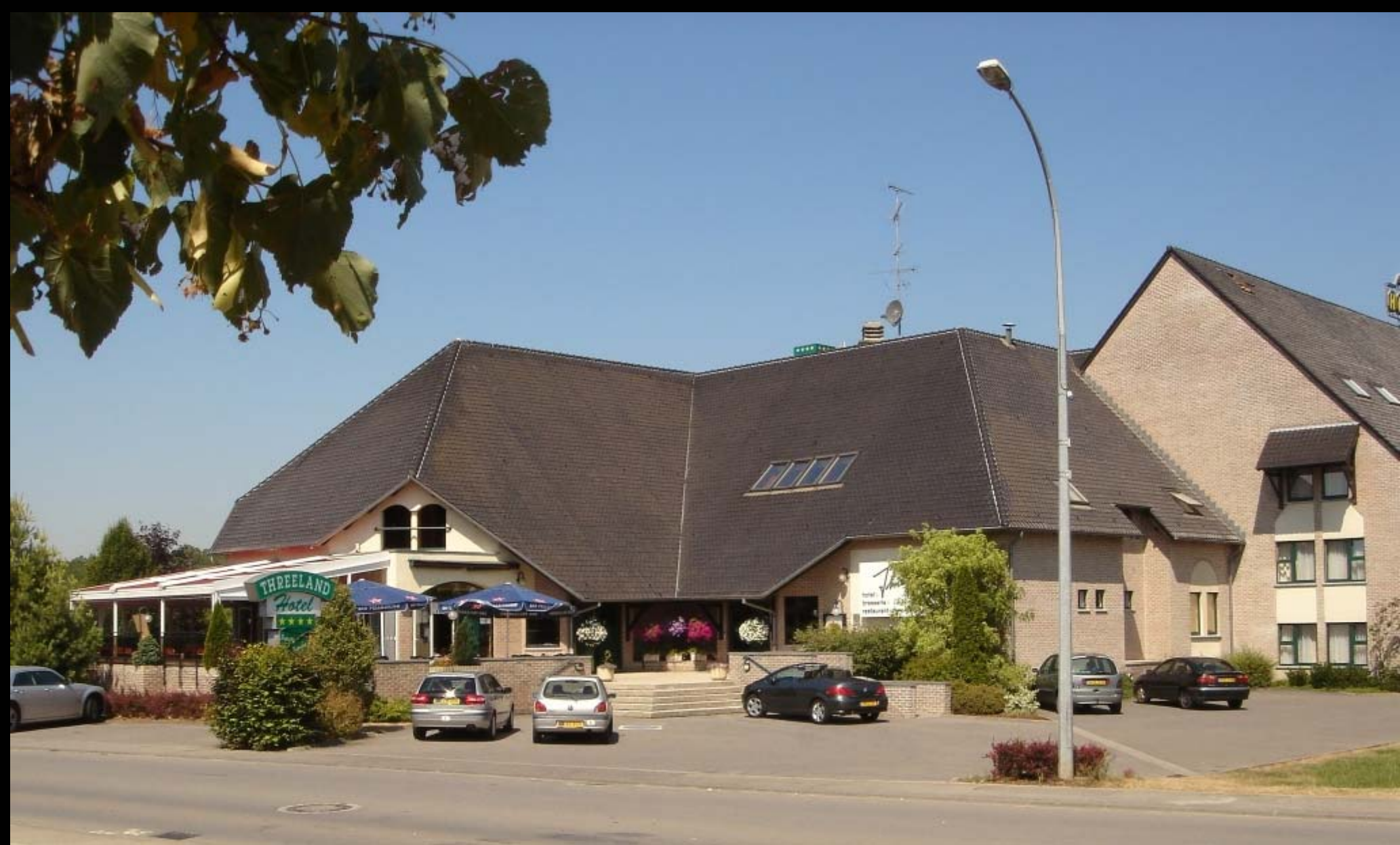
Hôtel-restaurant « Threeland », 50 rue Pierre Hamer, L-4737 - PÉTANGE, tél +352 2650800 Réunions les jeudis à 19h00 les semaines paires et les mercredis à 12h15 les semaines impaires.